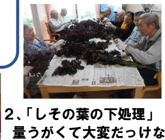
2、「しその葉の下処理」 量うがくて大変だっけな