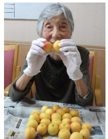
大きな梅を頂いて