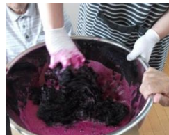
3、「しその葉揉み」 かいは力いるんだ