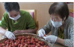
1、「軸取り」 爪楊枝でチクチク