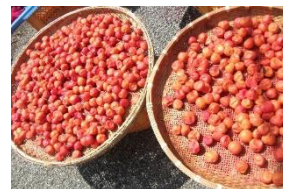
4、「天日干し」 暑っついっけね