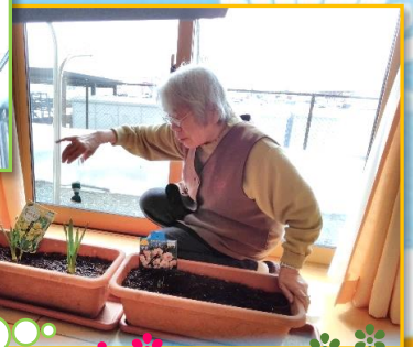
毎日の日課として、 花への水やり♪ きれいな花が 咲きますね♡