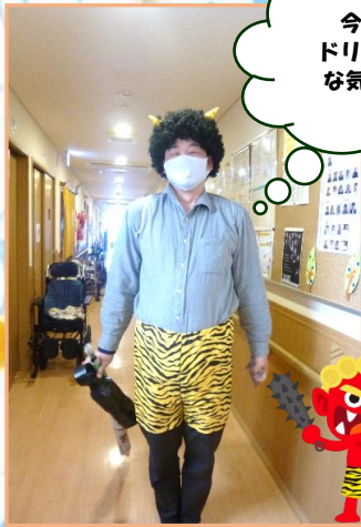
今月の一枚♪ ドリフで見たよう な気が…(ω\)