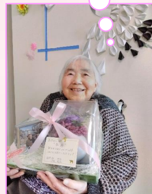
ぼあちゃん、教えてみる～♪