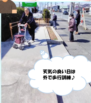
天気の良い日は外で歩行訓練♪