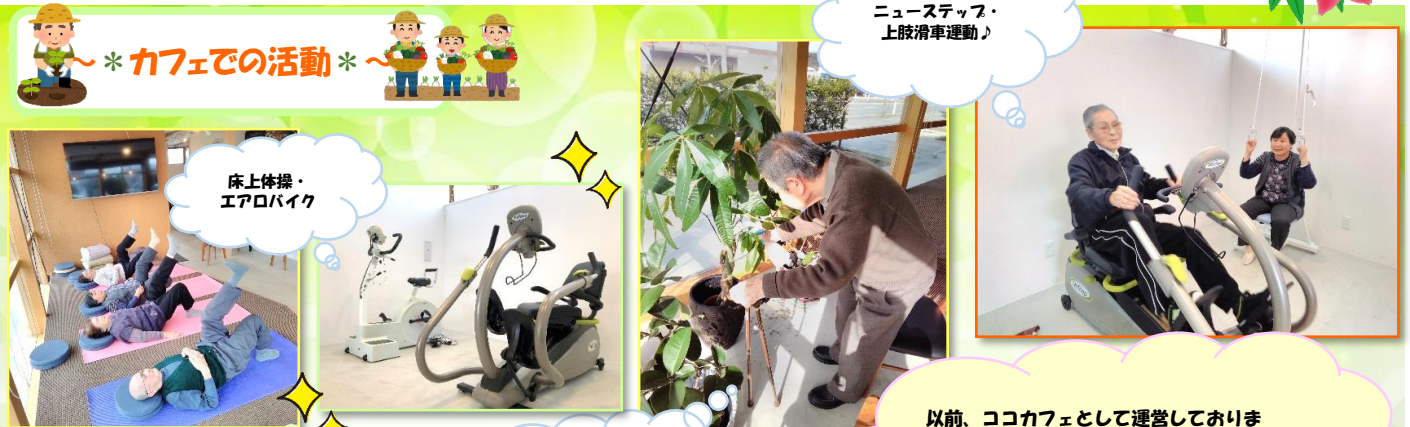
* カフェでの活動 *