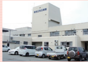
市立病院 (約300m・徒歩約4分)