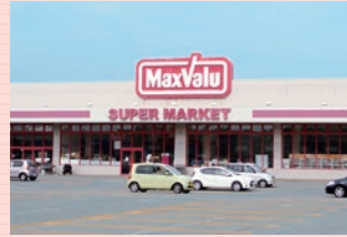
マックスバリュ (約350m・徒歩約5分)