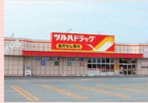
ツルハドラッグ (約300m・徒歩約4分)