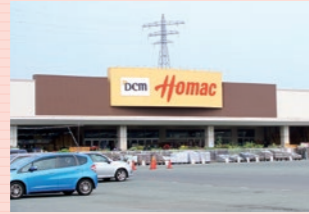
ホームマック (約300m・徒歩約4分)