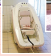
車椅子対応特殊入浴装置