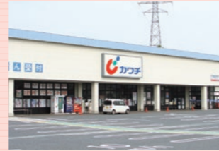
カワチ薬品 (約450m・徒歩約6分)