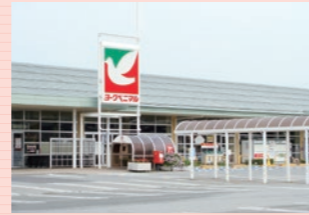
ヨークベニマル (約300m・徒歩約4分)