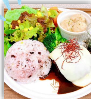
ハンバーグプレート 1,100 円(税込)