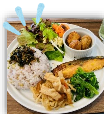
日替わり健康プレート 800 円(税込)

LED 水耕栽培とは、植物の成長に必要な光を効率的に提供し、土を使わず液肥で育てる栽培方法です。